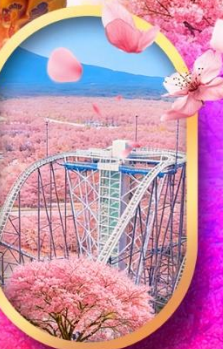
ฟูริยาม่า ทาวเวอร์