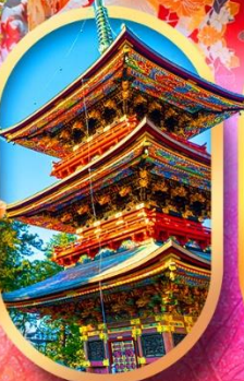
วัดนาริตะ-เซ็น