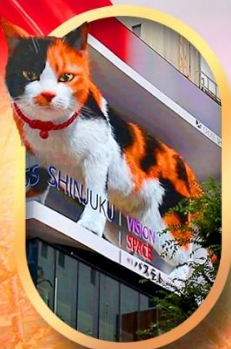
ซ้อปิ้งชินจูกุ