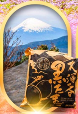
หุบเขาไอวาคุดานิ