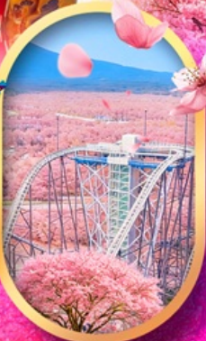
ฟูจิยาม่า ทาวเวอร์