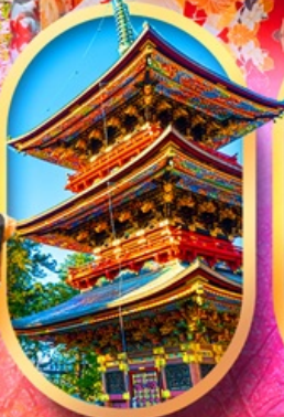
วัดนาริตะชิน