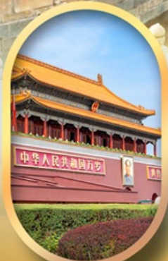
จัสมตริสเทียนอันเหมิน