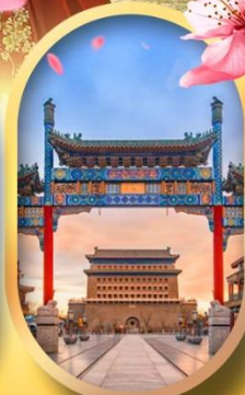
ถนนคนเดินเสียนเหมิน