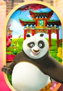
OPTION Universal Studios