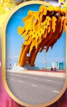
สะพานมังกรดานัง