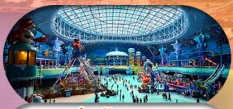
รวมค่าเข้าชมสนุก Spaceship Park