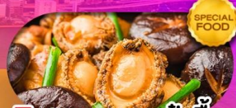
พิเศษเมนู หอยเป๋าฮื้อ เดินทาง มีนาคม 69