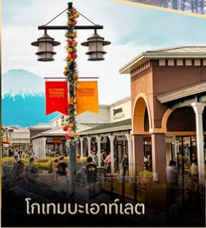
โทเทมเบเอาก์เล็ด