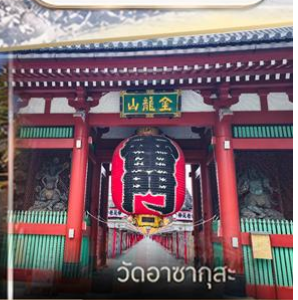
วัดวอดาซากุสะ