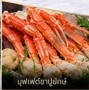
บุฟเฟ่ต์ซาปูยักซ์