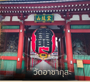
วัดอาสาซุกุสะ