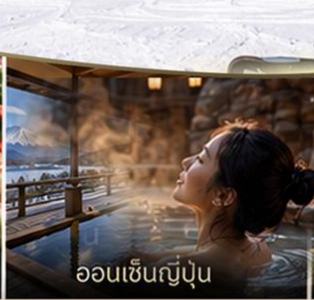
ออนเซ็นญี่ปุ่น