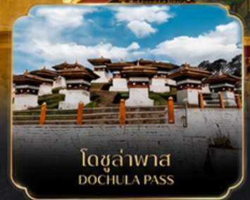
โดชูล่าพาส DOCHULA PASS