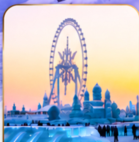
เทศกาลแกะสลักน้ำแข็ง Harbin Ice and Snow Festival