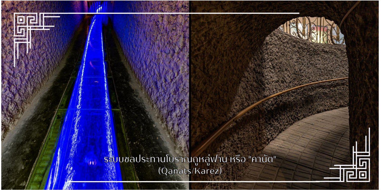
ระบบชลประทานโบราณคูหลู่ฟาน หรือ “คานัต” (Qanats/Karez)

ระบบชลประทานโบราณคูหลู่ฟาน หรือ “คานัต” เป็นระบบส่งน้ำใต้ดิน ในเขตซินเจียง ประเทศจีน ใช้ภูมิปัญญาชุดอุโมงค์ ใต้ดินเชื่อมต่อกัน เพื่อนำน้ำจากหิมะละลายบนภูเขามาใช้ในโอเอซิสทะเลทราย ลดการระเหยของน้ำ ทำให้เมืองคูหลู่ฟาน อุดมสมบูรณ์และเป็นแหล่งปลูกองุ่นขึ้นชื่อ