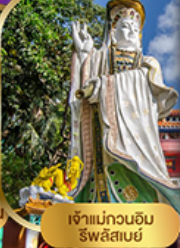
เจ้าแม่กวนอิม รวิไลสมย์