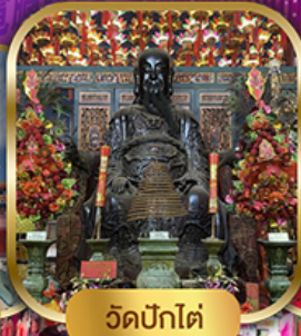
วัดปึกใต้