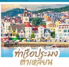
ท่าเรือประมง ต้าเหลียน