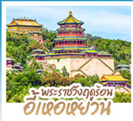
พระราชวังฤดูร้อน อี่เซวี่ยน

ทริปเดียวเที่ยว 2 เมือง ปักกิ่ง-ต้าเหลียน • เที่ยวจีนฟีลยุโรป ณ เมืองเวนิสแห่งต้าเหลียน • สัมผัสประสบการณ์ขึ้นกำแพงเมืองจีน ด่านจวิ๊ยกกวน • ช้อปปิ้ง ซิม ซิล ที่ถนนโบราณตงกวนและย่านซานหลี่ถู่