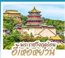
พระราชวังฤดูร้อน อี่เซว่น

ทริปเดียวเที่ยว 2 เมือง ปักกิ่ง-ต้าเหลียน • เที่ยวจีนฟัลยูโรป ณ เมืองวนิสแห่งต้าเหลียน • สัมผัสประสบการณ์ขึ้นกำแพงเมืองจีน ด่านจวิยงกวน • ซ้อป ซิม ซิล ที่ถนนโบราณคกงวนและย่านชานหลี่กุน