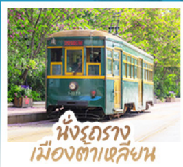
นั่งรถราง เมืองต้าเหลียน