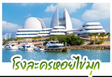
ริงละครเรือยี่ไข่มุก