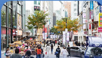
ซ้อปบั้งข่านเม็งงดง