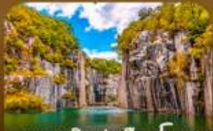
เขตเขาตึกลปะเมืองโพซอน

ตามหาใบไม้เปลี่ยนสีสุดโรแมนติก ชมวิวแบบพาโนรามาจากสะพานแขวนรูปตัว Y แห่งเมืองโพซอน สัมผัสความงดงามของโพซอนฮาร์วีย์แลนด์ • เติมน้ำมันท่ามกลางคิมแจเป็ทวียและเทปัลในพร-ราชวังเคียงบกกุง ชมหมู่บ้านฉิมอกกลางบรรยากาศอันชุก และปิดท้ายด้วยหมู่ทิวทัศน์อง ณ สวนอานีส และศูนย์ถ่ายทอดนิยามของกรุงโซล ในช่วงฤดูใบไม้เปลี่ยนสีที่สวยงามที่สุด