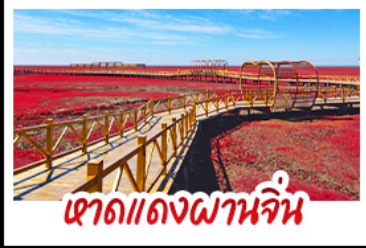
เขาดแคงพานจัน