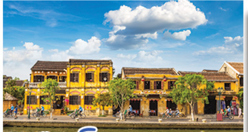
เมืองโบราณซองอัน