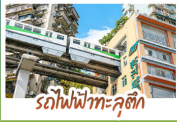
รถไฟฟ้าทะเลคุตึก

ชมธรรมชาติ ณ อู่หลิง ชมหุบเขาสุดอลังการระดับมรดกโลก นั่งรถไฟฟ้าที่สวยที่สุดที่หมีจ้อป่า สัญลักษณ์เมืองฉงชิ่งสุดล้ำ สัมผัสวิถีภูเขาหิมะแห่ง ภูเขาสี่ดรุณี งดงามจนได้รับฉายา "เทือกเขาแอลป์แห่งตะวันออก" ชมธรรมชาติสุดฟิน ณ อุทยานป่าเผิงโกว • ซุปป์โม่จู่ใจ ถนนคนเดินไท่กู่หลี่, ถนนคนเดินซุนซื่อ