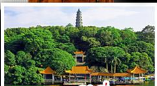
ภูเขาชิงชิว