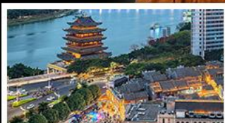
ถนนคนเดินสามตรอกสองซอย