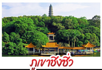
ภูเขาชิงชิง