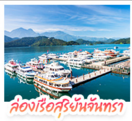
ล่องเรือสุริยันจันทร์รา

ล่องเรือชมทะเลสาบสุริยันจันทร์รา (SUN MOON LAKE) ชมเกาะลาลู แคว-วัดสวนทอง • อิสระเดินเล่น หมู่บ้านอิต้าซ่า • นั่งรถไฟเล็กโบราณ (1 สถานี) สัมผัสบรรยากาศเส้นทางรถไฟสายธรรมชาติ • ตะลุย ไทจงโมก้ามาร์เก็ต แหล่งรวมแฟชั่นและสตรีทฟู้ด • ช้อปปิ้งย่าน ซิเหมินตง (XIMENDING) ถ่ายรูปแลนด์มาร์ค ตึกไทเป 101 • ช้อปปิ้งที่ Mitsui Outlet Park ชมความสวยงามของ อนุสรณ์สถานเจียงไคเช็ค • ขอพรความรักที่ วัดหลงซาน ชมโศกหินเศียรราชินีที่ เย่หลิว • ชมบรรยากาศเมืองเก่าที่ จิวเฟิน