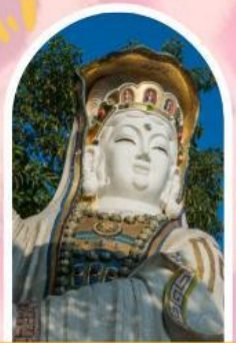
ริพลัสเบย์ รับพลังงานดี เสริมพลังดวงจัญ