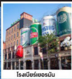
โรงเบียร์เยอรมัน