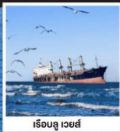
เรือลู่ เวย์ส์