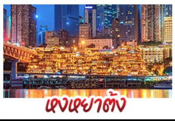
เฉงเฉงฮ้าง