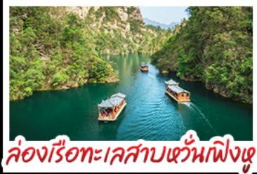
ล่องเรือทะเลสาบเขวันผิงเต๋