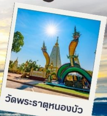
วัดพระธาตุหนองบัว