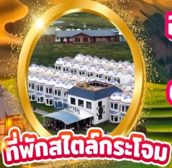
ที่พักสไตล์กระโจม