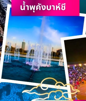
น้ำพุคังบาศี