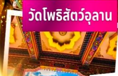
วัดโพธิสัตว์อูลาน