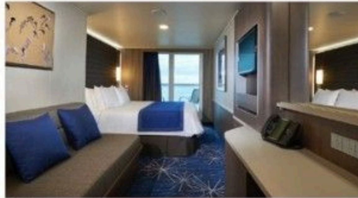
Club Balcony Suite