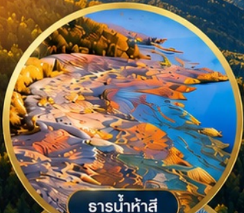
ธารน้ำห้ำสี