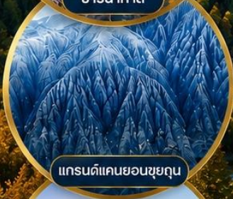
แกรนด์แคนยอนชุยถุน