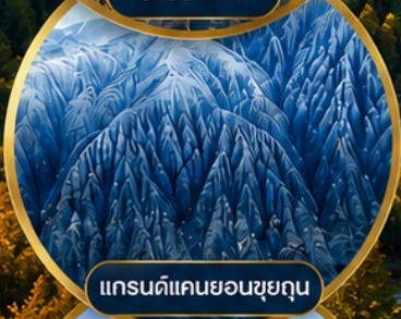
แกรนด์แคนยอนชุยถุน