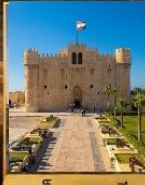
อเล็กซานเดรีย