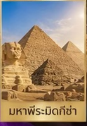
มหาพีระมิดกิซ่า