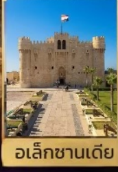
อเล็กซานเดีย