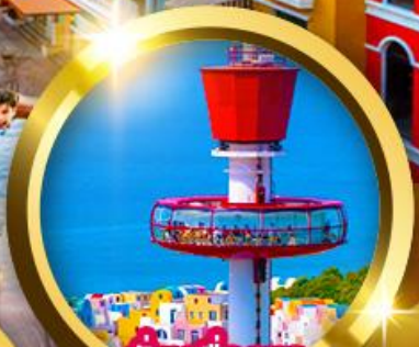
นั้งเครื่องยก Eagle Eye

"เวนิสแห่งเอเชีย" Grand World Phu Quoc สถาปัตยกรรมสไตล์ยุโรปหลากสีสัน