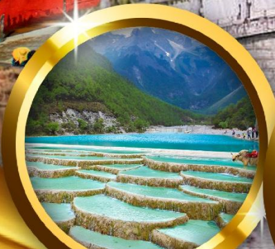
ทะเลสาบใ้สวยเห่อ