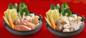
สุกี้ปลาแซลมอน+สุกี้เห็ด