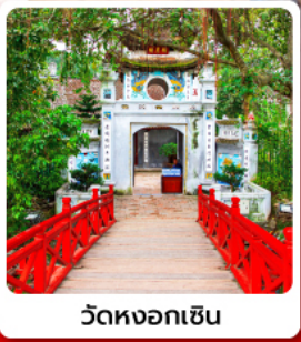
วัดหงอกเซิน