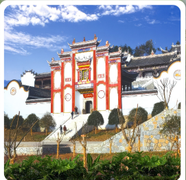
บ้านเกิดชวีหยวน