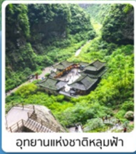
อุทยานแห่งชาติหลุมฟ้า

เดินทาง เมษายน - มิถุนายน 2569 ราคาเริ่มต้น 15,888