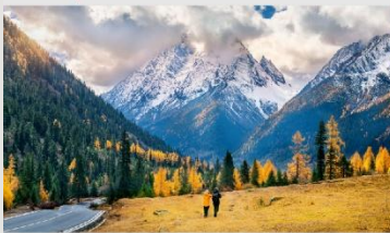
ภูเขาสี่ดรุณี (หุบเขาชวงเฉียวโกว)