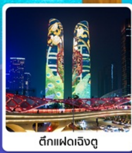
ตึกแฟดเจิงตุ