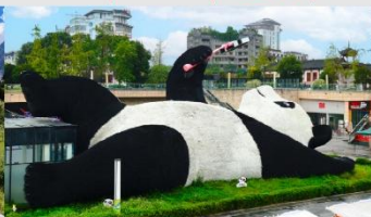
รูปปั้นหมีแพนด้าอนเซลฟี่