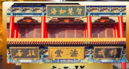
วัดจิ้นไถ่