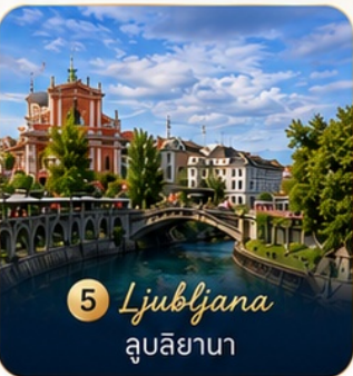
5 Ljubljana ลูบลิยานา