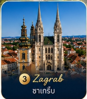
3 Zagreb ซาเกร็บ