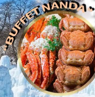
LAKE SHIKOTSU ICE FESTIVAL 2027