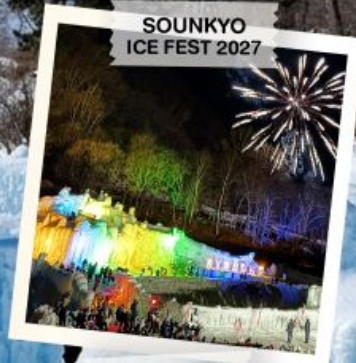
SOUNKYO ICE FEST 2027