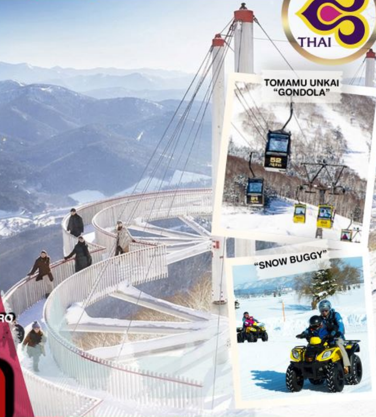
TOMAMU UNKAI "GONDOLA"