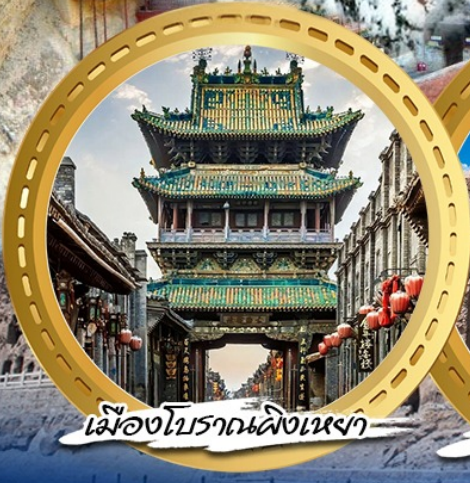
เมืองโบราณผิงเหยา