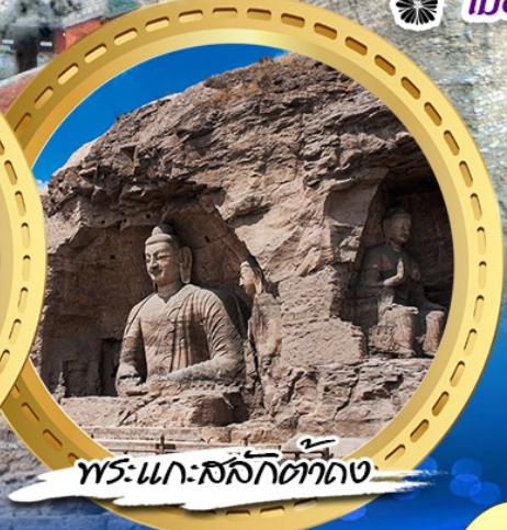
พระแกะสลักต่าง ๆ