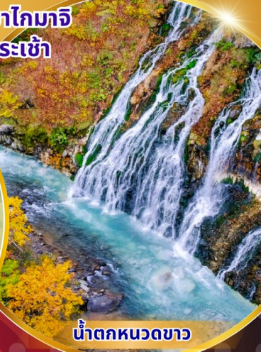
น้ำตกหมวดขาว