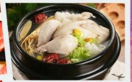
อาหารวังหลวงไก่ตุ๋นโสม