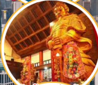
ไหว้พระวัดดัง