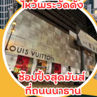
ช้อปปิ้งสุดมันส์ ที่ถนนนคราณ