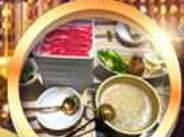
บุฟเฟ่ต์ชาบู เบียร์ไม่อั้น!!