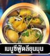
เมนูซีฟู้ดสัญมุน