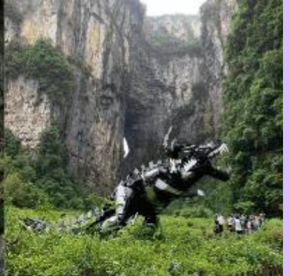
THREE NATURAL BRIDGE