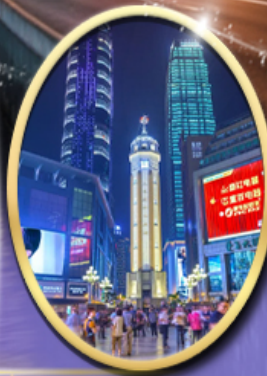
ถนนคนเดินเจียฟางเป็ย