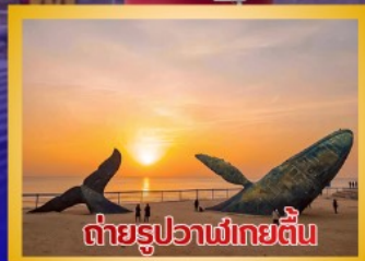
ต่ายรูปวาฬยักษ์ตื่น