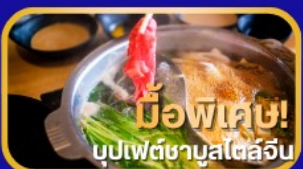
มีอาหารพิเศษ! บุปเฟ่ต์ชาบูสไตล์จีน