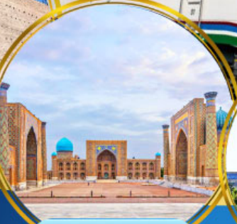
จัตุรัสเรจิสถาน